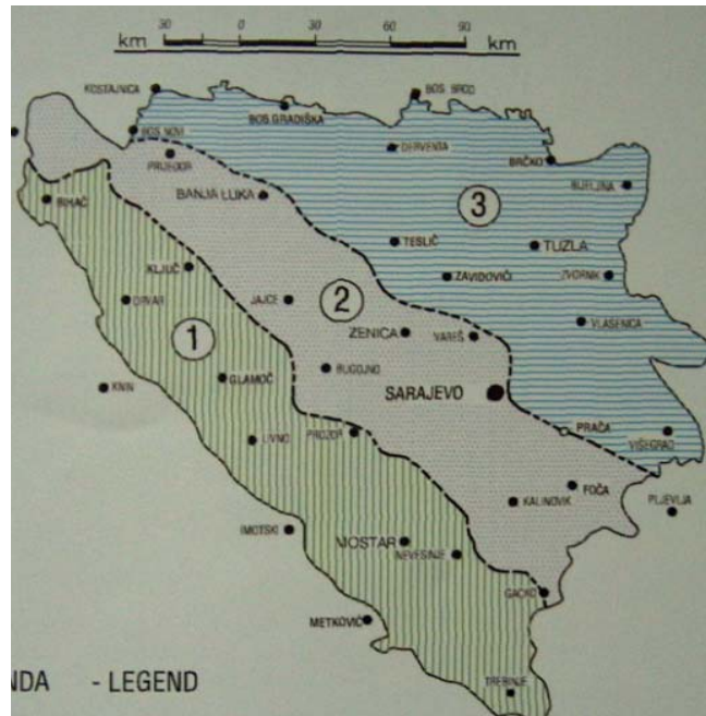
Slika 1. Geotektonska slika Dinarida BiH (1) VANJSKI DINARIDI; (2) SREDIŠNJI DINARIDI; (3) UNUTARNJI DINARIDI

U strukturno-tektonskom smislu područje Hercegovine i jugozapadne Bosne pripada Vanjskim Dinaridima i manjim dijelom prijelaznoj zoni. Karakteristično je da su slojevi velike debljine i da su zastupljeni veliki nabori u kojima se u dnu sinklinale obično nalaze paleogene naslage, dok su tjemena često duboko erodirana, razlomljena i gotovo svugdje navučena na sinklinalne dijelove.