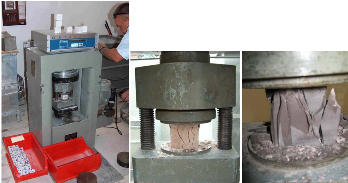
Slike 3, 4, 5. Ispitivanje kamena: tlačna čvrstoća (lijevo), s detaljom u adapteru za precizno centriranje uzorka (sredina i desno)

tom trenutku, u IGH d.d. Zagreb – Zavod za prometnice su provedena sva propisana ispitivanja, koja se sastoje od 2 kompletna i 13 djelomičnih ispitivanja, sukladno «Pravilniku o klasifikaciji i kategorizaciji čvrstih mineralnih sirovina i vođenju evidencije o njima (SL 53/79)». Od otvaranja laboratorija «IGH-Mostar» u proljeće 1997. godine, te Centralnog laboratorija u novoj poslovnoj zgradi „IGH-MOSTAR“ u ljeto 2007. godine do danas izvršena su brojna ispitivanja kamena iz ležišta s područja Hercegovine, uključujući Livno i Tomislavgrad, ležišta iz Središnje i jugozapadne Bosne, te kamenolom Lapišnicu kod Sarajeva.